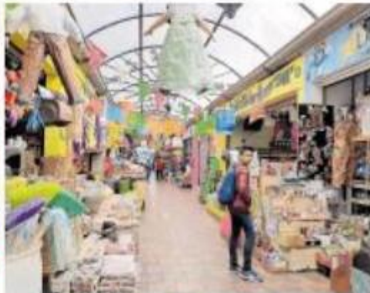
Gracias a que los comerciantes realizaron un abasto oportuno de mercancías, contribuyeron de manera sustancial para que no hubiera desabasto, aseguró la Cámara

MACÍAS RECHAZA informal que un número porcentaje del 5.5% del comercio normal ha beneficiado por créditos o apoyos estatales.